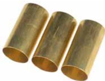
Casquillos de latón