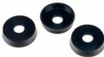
Sello para pistón