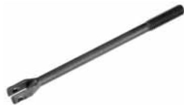
Varilla de acoplamiento