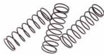
Muelles de retorno