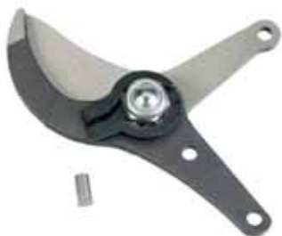
Cabeza cortante para podadera neumática