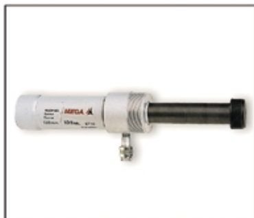
Cilindro de tracción. Opcional