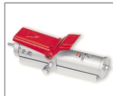
NS-1 Bomba oleoneumática. Opcional

La fuerza máxima del cilindro de expansión SH-1 es de 1t y la carga máxima de trabajo de la cadena es de 1t en el modelo GC-10 y de 500 kg en el GC-5.