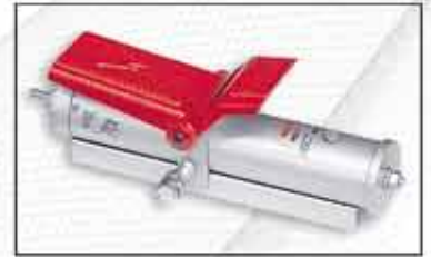
NS-1 Bomba oleoneumática. Opcional

Para reparar con precisión las carrocerías más fuertemente dañadas. La posibilidad de giro del brazo de nuestra escuadra incrementa su versatilidad al permitir realizar trabajos de tiro en diagonal.