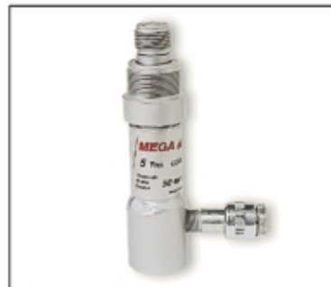
Cilindro de empuje. Opcional